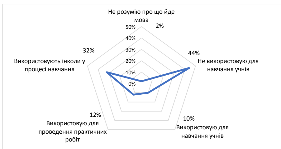
Рис. 3. Використання СКМод для навчання учнів

На запитання про використання цифрових симуляторів 10% вчителів зазначили, що використовують СКМод в навчальній діяльності учнів, 44% – зазначили, що не використовують СКМод, а 2% - відповіли, що не розуміють про що йде мова. Деякі вчителі, частка яких склала 32% вказали, що застосовують СКМод не систематично; а 12% - застосовують СКМод під час практичних робіт (рис. 3).