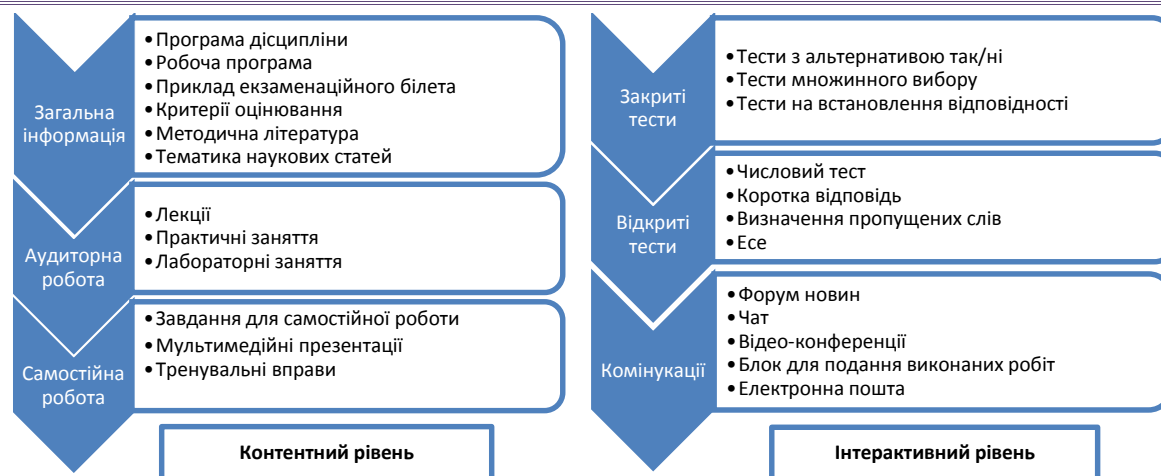
Рис. 1. Наповненість сторінки ПНС за кожною навчальною дисципліною математичного циклу