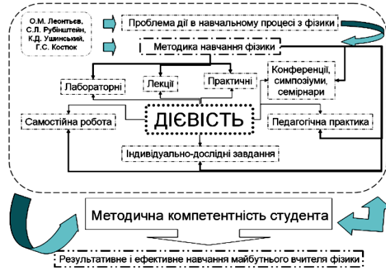
Рис. 2. Дієвість як методична компетентність майбутнього вчителя фізики

Таким чином, ми провокуємо студентів виявляти творчу активність на практичних заняттях. Дієвість практичних занять з МНФ підкріплюється високою якістю засвоєних знань і активним залученням до наукової діяльності через участь у наукових конференціях, виступах із доповідями, розробленням комп'ютерних програм з шкільної фізики, презентацій наукових доповідей, ефективним проходженням активної педагогічної практики – формуванням методичної компетентності вчителя фізики [1; 3; 6].