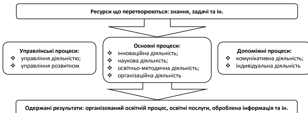
Рис. 2. Процесна модель діяльності співробітника організаційно-навчального підрозділу університету

На сьогодні основні процеси напряму залежать від використання та застосування сучасних засобів ІКТ при організації освітнього процесу. На основі процесного підходу пропонуємо таку модель діяльності працівника організаційно-навчального підрозділу університету (див. рис. 2):