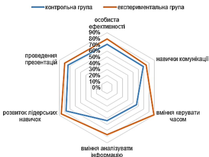
Рис. 4. Результати опитування студентів ІТ-фаху

Щоб визначити ставлення студентів до роботи з хмарними сервісами та ресурсами в процесі неформальної освіти, що надає компанія Microsoft та рефлексії набуття професійних, комунікативних і особистісних навичок, мотивації було розроблено анкету з 10 питань. Анкетування проводилось на навчально-інформаційному порталі НУБіП України. Аналізуючи результати анкетування можна зробити висновок, що більшість студентів (82,8%) бажають і надалі вивчати курси в Microsoft Imagine Academy, а також використовувати інші хмарні ресурси та сервіси для поглиблення знань, вмінь і навичок. 49,5% студентів ІТ-фаху задоволені альтернативою зарахування певних видів робіт, їх і надалі влаштовують зарахування неформальної освіти в межах професійних дисциплін. Студенти експериментальної групи продемонстрували якості більш швидкого просування від ідей до вміння порівняно з контрольною групою, що свідчить про більш сформовані навички особистої ефективності, комунікації, вміння керувати часом та аналізувати інформацію, а також здатність проведення презентації (рис. 4).