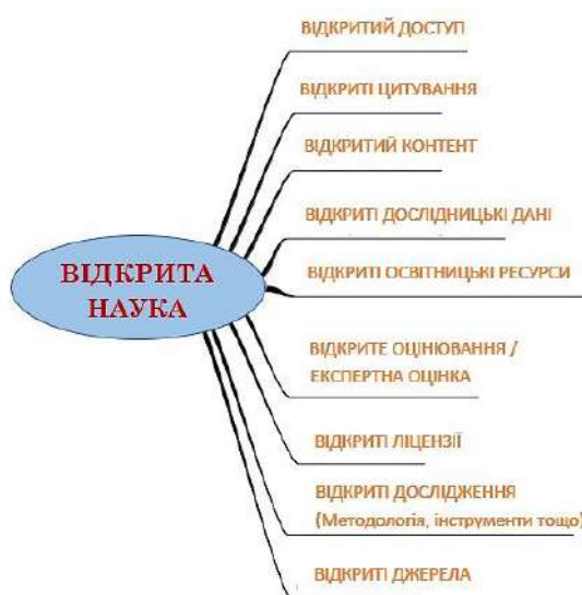
Рис. 2. Дерево таксономії відкритої науки (Baumgartner, 2019)

На рис. 2 відображено дерево таксономії відкритої науки. Однак, аналіз джерельної бази показує, що основна увага зосереджується на двох напрямках: відкриті дані досліджень та відкритий доступ до наукових публікацій.